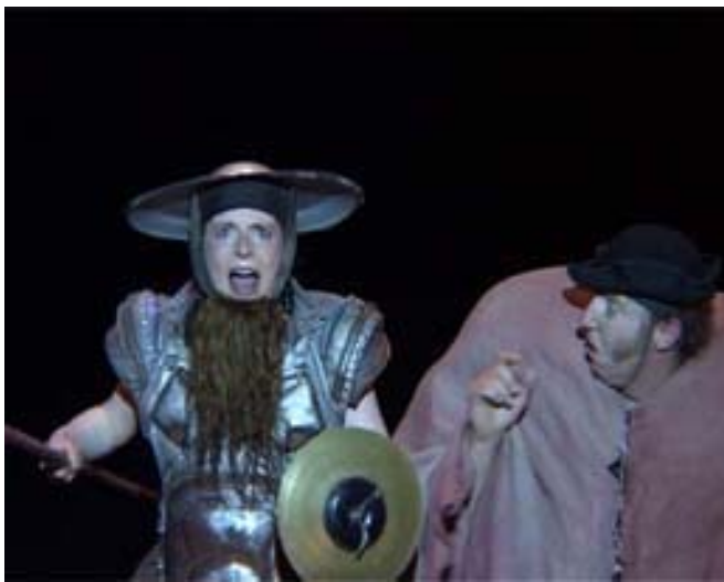
Don Quichotte et Sancho Pança face aux moulins à vents.