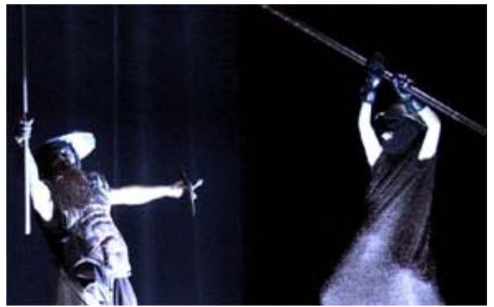
Don Quichotte contre le géant Micocolembo.